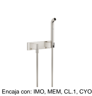
Encaja con: IMO, MEM, CL.1, CYO