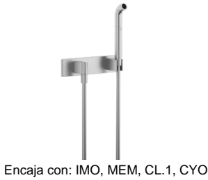
Encaja con: IMO, MEM, CL.1, CYO